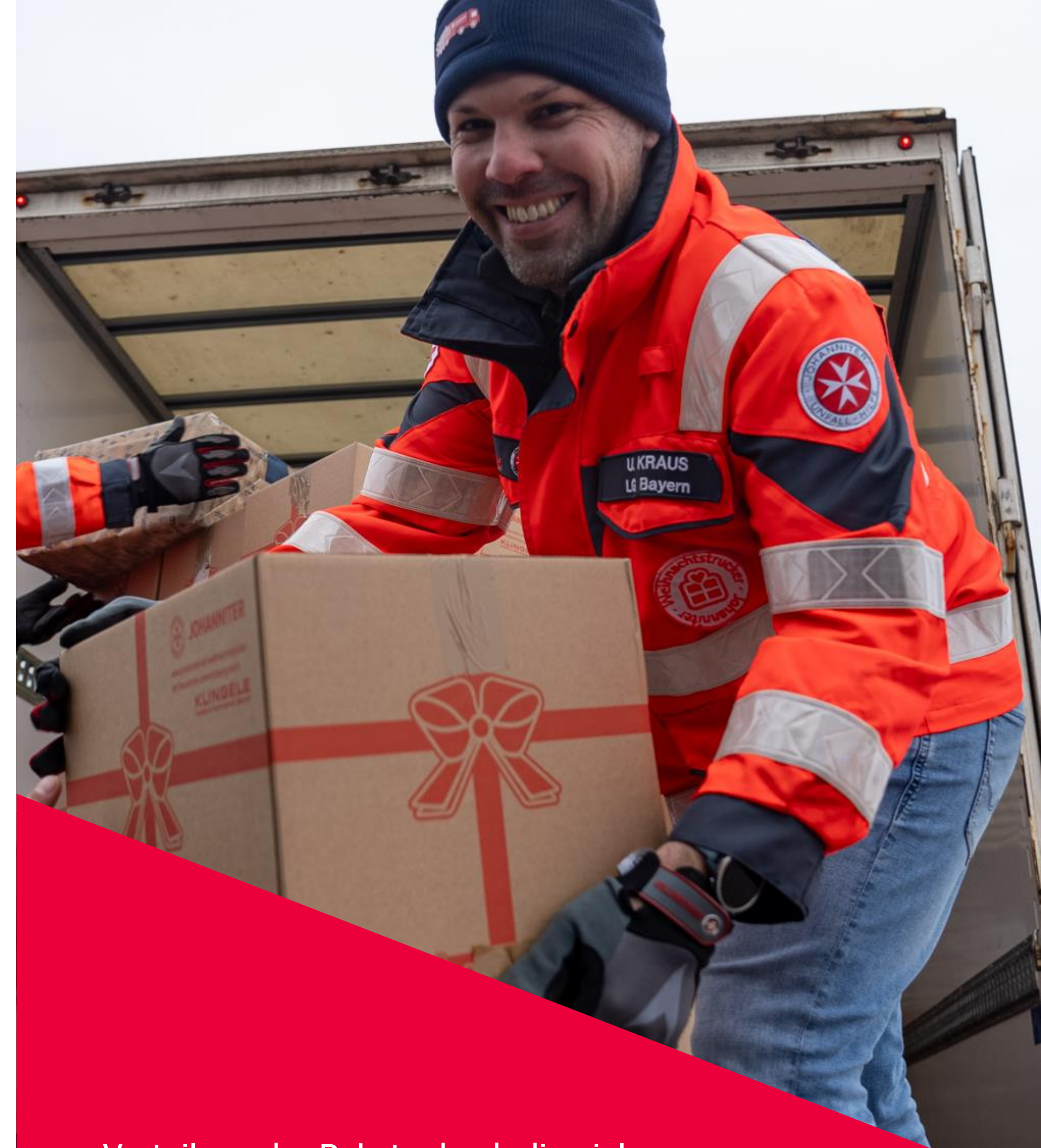
Verteilung der Pakete durch die vielen ehrenamtlichen Helfer