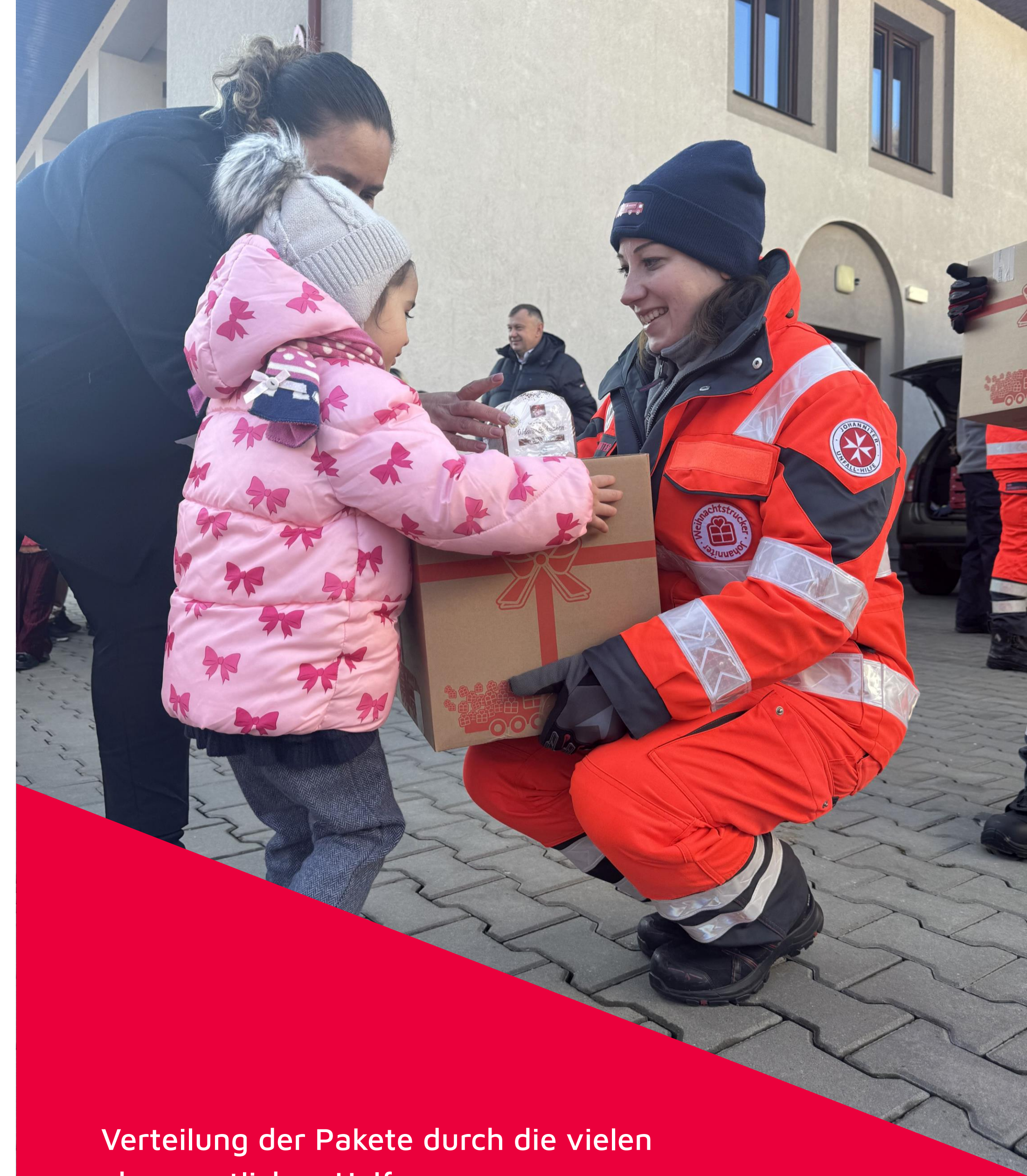
Verteilung der Pakete durch die vielen ehrenamtlichen Helfer